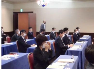
理事研修会の様子